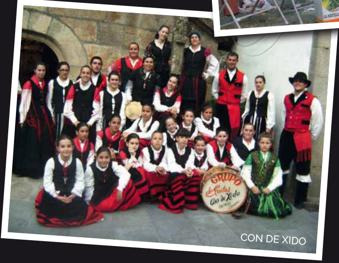
CON DE XIDO